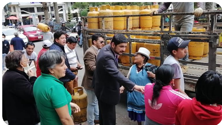
Gobernación del Cañar