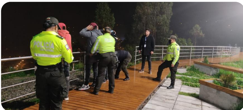
Gobernación del Cañar

La seguridad ciudadana no es solamente la respuesta que da la Policía Nacional frente al cometimiento de un delito, es, primordialmente, la capacidad del Estado de consolidar las políticas necesarias para, en colaboración de la ciudadanía, erradicar la violencia y obtener la convivencia pacífica de sus miembros.