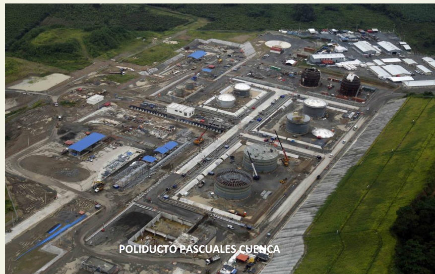
POLIDUCTO PASCUALES CUENCA