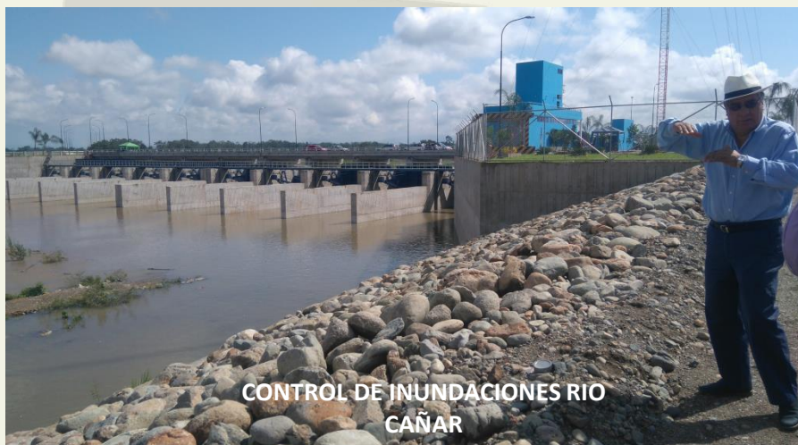
CONTROL DE INUNDACIONES RIO CAÑAR