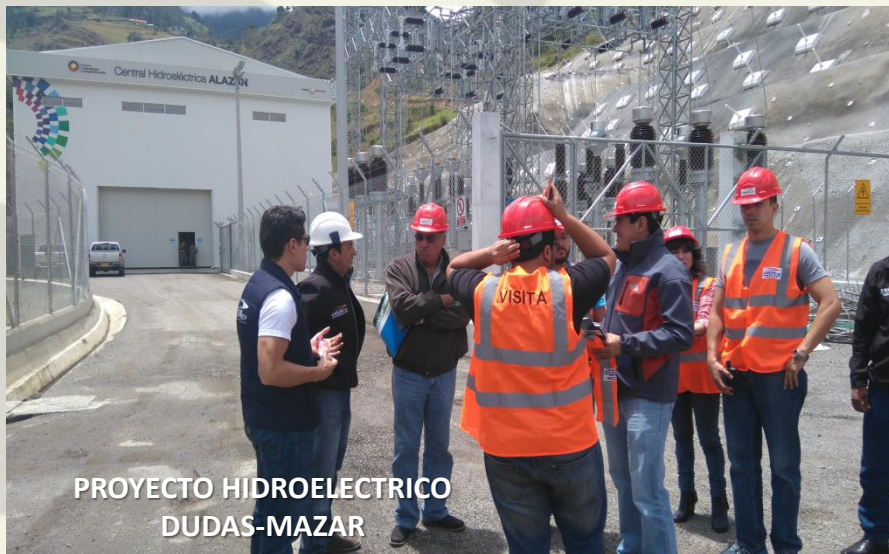
PROYECTO HIDROELECTRICO DUDAS-MAZAR