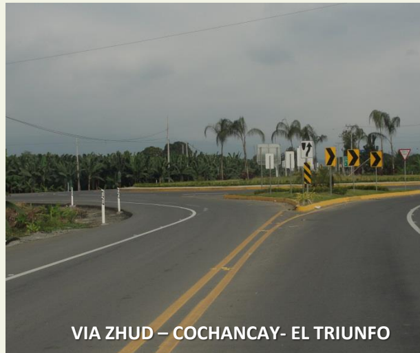
VIA ZHUD - COCHANCAY- EL TRIUNFO