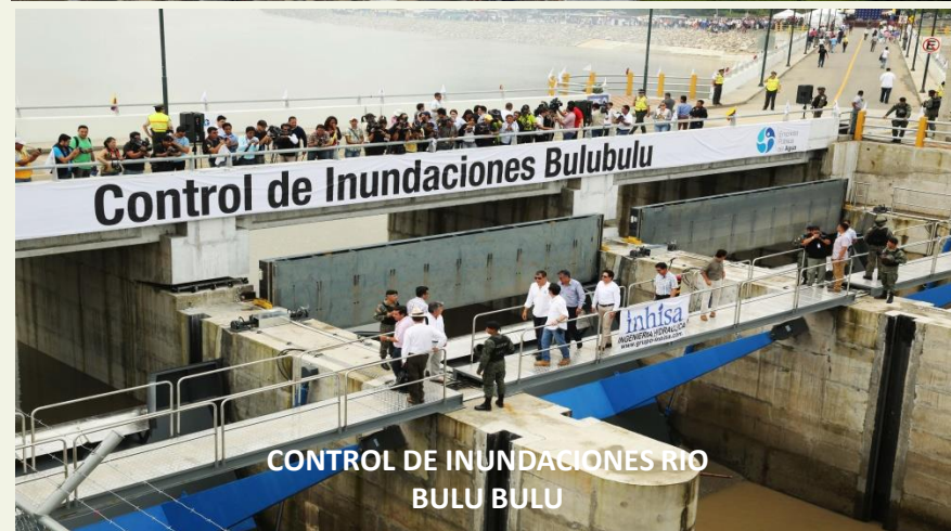
CONTROL DE INUNDACIONES RIO BULU BULU