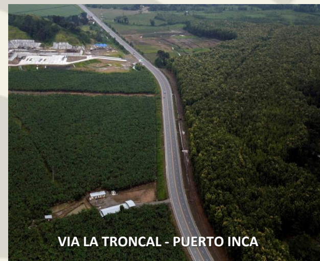
VIA LA TRONCAL - PUERTO INCA