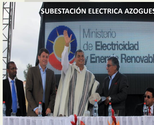
SUBESTACIÓN ELECTRICA AZOGUES